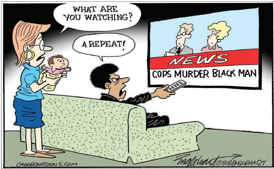
تکرار قتل سیاه پوستان توسط پلیس آمریکا باعث شده که این مرد در حال تماشای اخبار، به زتش که می‌برسد چه می‌بینی بگوید یک برنامه تکراری!

پیش‌تر گزارش شده بود که معلمان در انگلیس و ولز قرار است چهارشنبه اعتصاب کنند. این نخستین اعتصاب هفت روزه‌ای است که با فراخوان اتحادیه صنفی «آموزش ملی» انجام می‌شود. این اتحادیه بزرگترین اتحادیه صنفی بخش آموزش و پرورش در بریتانیا است. به نوشته روزنامه «گاردین» علاوه بر معلمان، اعضای اتحادیه آموزشی در انگلیس و ولز اعتصاب خواهند کرد. تخمین زده شده که ۲۳۴۰۰ مدرس در طول ۷ روز اعتصاب با مشکلات عمده‌ای مواجه شوند. اعتصاب بعدی توسط اعضای این اتحادیه اواسط ماه فوریه در ولز انجام خواهد شد. در انتهای فوریه و در انگلیس مجدداً اعتصاب برگزار خواهد شد. در اسکاتلند نیز اعتصابات در بخش آموزشی در جریان است. قرار است در ایرلند نمایشی نیز اکثر معلمان در ماه فوریه دست به اعتصاب بزنند. (ایرنا و مشرق)