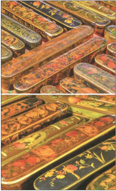
گران ترین اثر فروخته شده در نمایشگاه

آثار فروخته شده در شب حراج ملی به‌دست خریداران نرسید